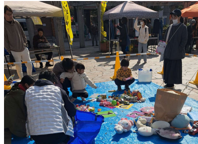
もらったビーノで交換できるおもちゃを選んでいる子どもたち