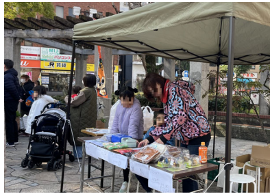
おしごと体験の様子