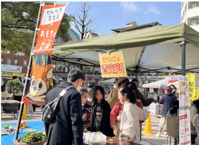
持ってきてもらったおもちゃを子どもたちが査定する様子